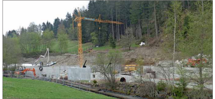
Wasserkraftnutzung ist wegen möglicher Auswirkungen auf Landschaft und Umwelt teils umstritten; ein gutes Beispiel für diese Diskussionen bot das Rambach-Werk (im Bild die Wasserfassung während der Bauphase). lie

Einer der Referenten war Flavio Ruffini von der Landesagentur für Umwelt und Klimaschutz. „Wir können durchaus stolz auf die Wasserkraft im Land sein“, sagte er. Dennoch müsse man aber stets alle Interessen im Auge behalten, somit auch jene der Natur. Ruffini sprach über die Landesklimatepläne und darüber, dass in Süd-